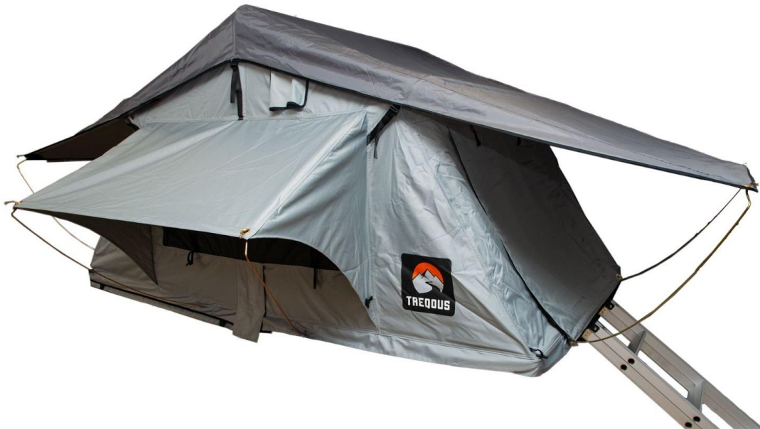
Trepous Softshell Polaris