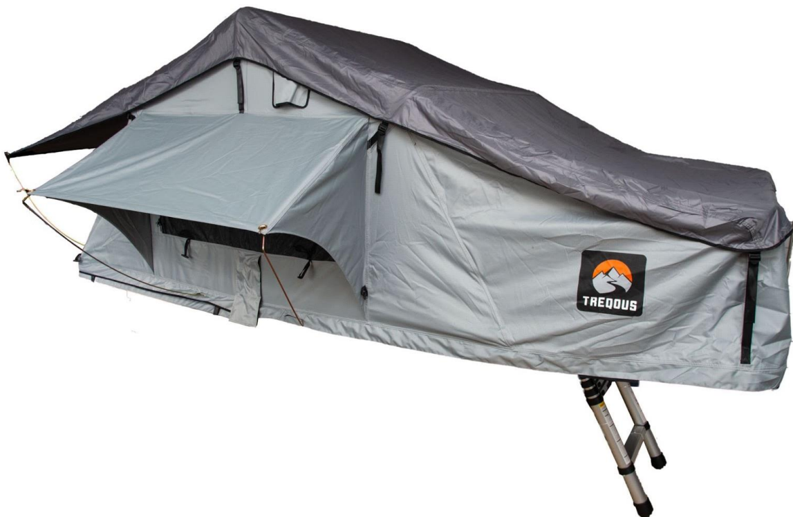
Trepous Softshell Mizar