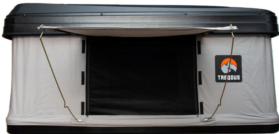
Treqous Hardshell Aurora