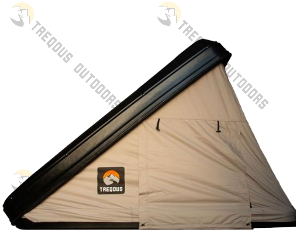
Treqous Hardshell Delta